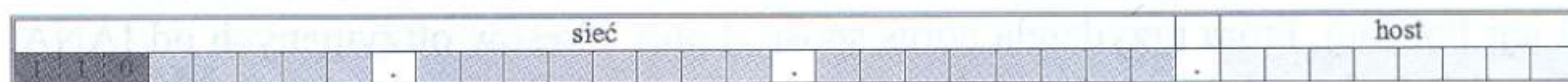
Rys. 1.6. Podział bitów w adresie klasy C

Adresy klasy C przeznaczono do obsługi dużej liczby małych sieci. W adresie klasy C pierwsze trzy oktety określają sieć, a ostatni – hosta. Podział bitów w adresie klasy C pokazano na rys. 1.6.